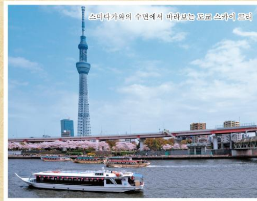
스미다가와와 수면에서 바라보는 도쿄 스카이 트리

금요일 19:00 토요일 18:00 일요일 18:00 (최소 인원수) 15명 *예약인수가 15명이 안될 경우에는 출항할 수 없으므로 양해해 주시기 바랍니다.