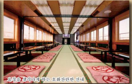
요정을 생각나게 하는 호화찬란한 선내