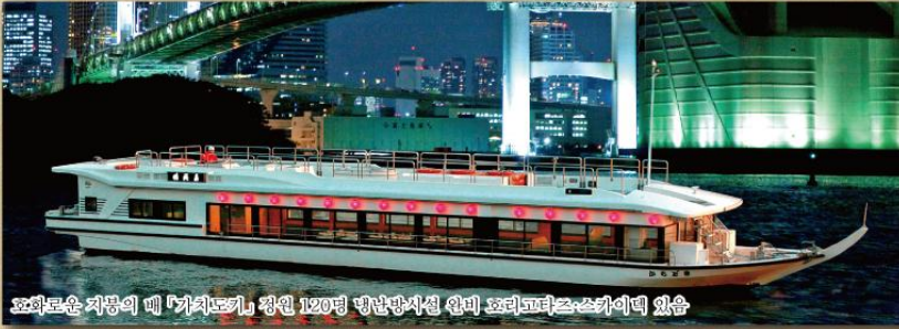
최대로운 저층의 배 「카치노키」 정원 120명 배낭방사선 안내 스피리도타스스카이네 있음

접대, 사은회, 회식, 망년회 · 신년회, 환송영회, 연수 · 세미나, 전시회, 꽃놀이, 불꽃놀이, 달맞이, 결혼식 피로연, 도쿄만 관광 etc.